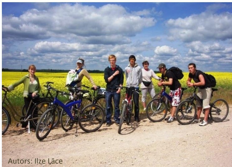
Autors: Ilze Lāce

Visi aktīvie un aizrautīgie velo entuziasti gaidīti spietojam fotoorientēšanās sacensībās Latvijas saldākajā pilsētā – Saldū. Pasākuma dalībniekiem- komandām no divām līdz piecām personām , sacensību laikā jāsavāc pēc iespējas vairāk punkti. Dzeltenie kontrolpunkti būs vienkāršāki – tajos pēc fotogrāfijām būs jāatrod konkrēts objekts un pie tā jānofotografējas savukārt melnie kontrolpunkti ar sarežģītāku uzdevumu – pēc fotogrāfijas jāatrod objekts un pie tā jānofotografējas, veicot konkrētu uzdevumu. Dalībnieki tiks vērtēti pēc uzdevumu veikšanas