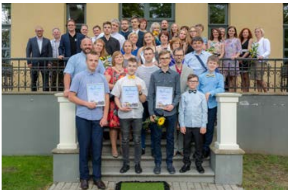
Skolēni, vecāki un skolotāji, kuri tika apbalvoti pasākumā "Mēs lepojamies"

17. maijā Skrundas muižā norisinājās ikgadējais Saldus novada skolēnu mācību priekšmetu olimpiāžu un zinātniski pētniecisko darbu konkursa Starptautisko un valsts uzvarētāju apsveikšanas pasākums "Mēs lepojamies".