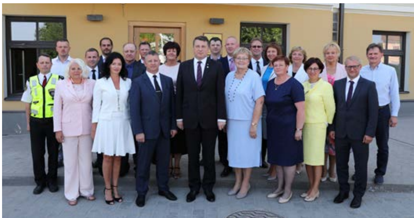
Valsts prezidents tikās ar Saldus novada domes vadību, domes deputātiem un nodaļu vadītājiem