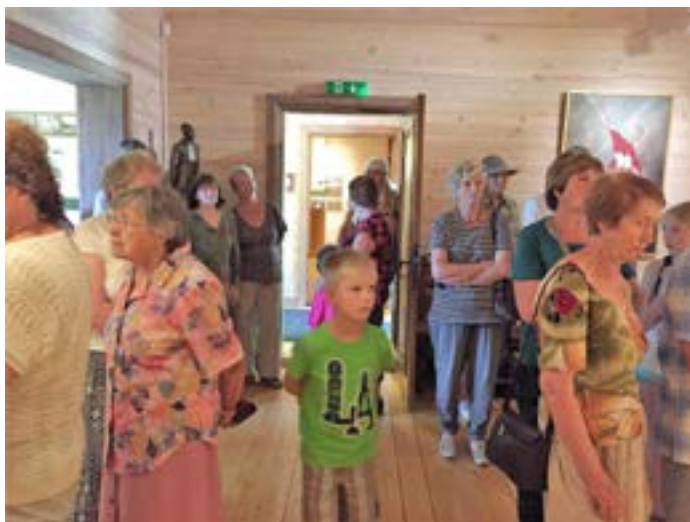
O. Kalpaka muzejā un piemiņas vietā “Airītes”

Svētdienā, 27. maijā, notika pirmā no trim Saldus TIKS centra organizētajām Simtgades ekskursijām. Šoreiz brauciens veda uz Zirņu un Novadnieku pagastiem, interesentus iepazīstinot ar staciju “Airīte”, O. Kalpaka muzeju un piemiņas vietu “Airītes” un Sātiņu zivsaimniecību.