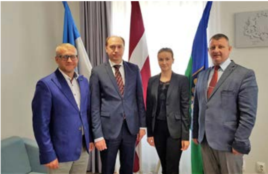
Saldus novada vadība ar Moldovas vēstnieku

5. jūnijā Saldū viesojās Moldovas vēstnieks Latvijā Eugen Revenco, kurš bija patīkami pārsteigts par saldenieku viesmīlību.